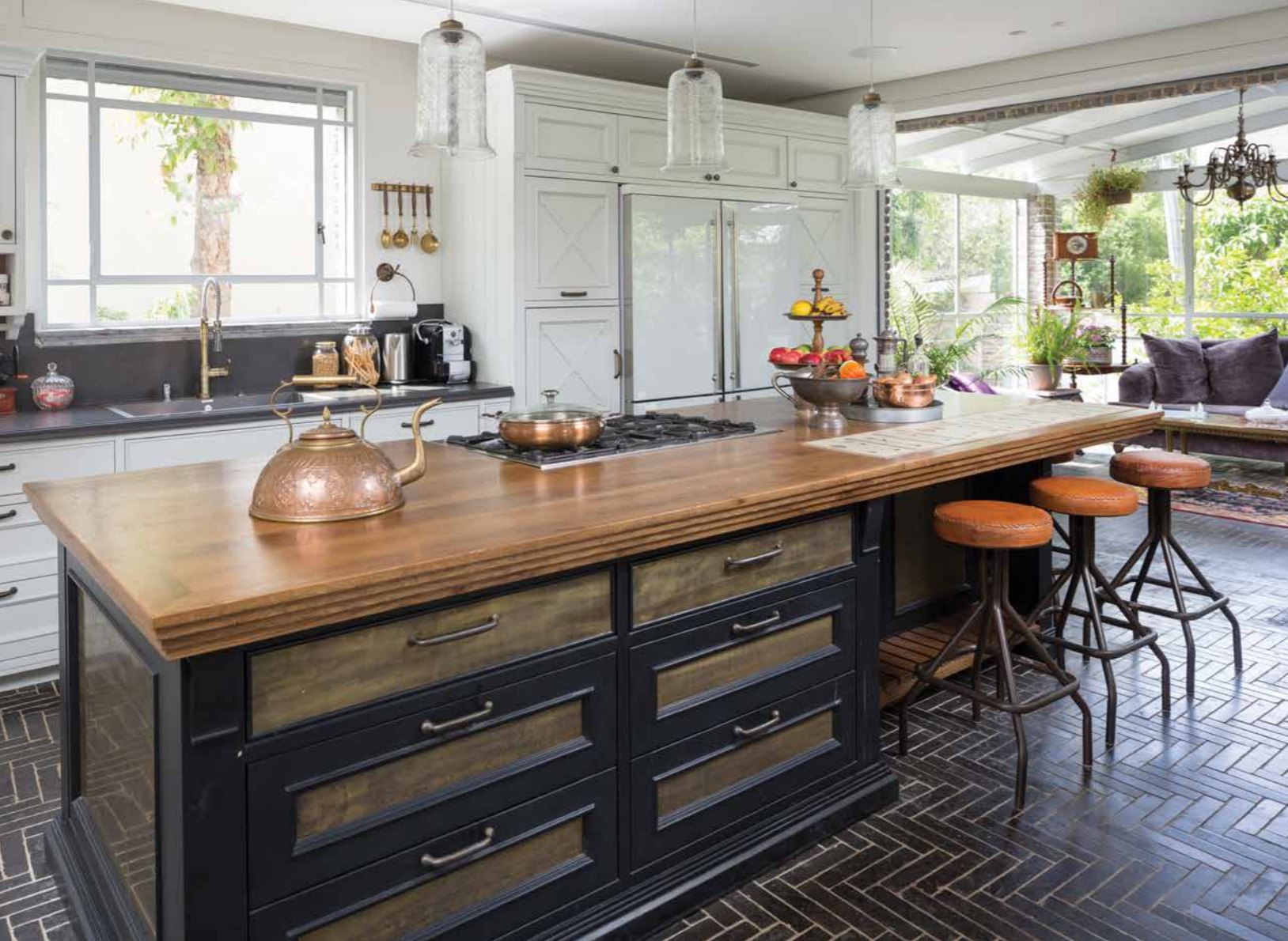
את פינת הישיבה הסלונית הוציא פרנס למרפסת סגורה, כביכול, למעשה זהו חדר הסגור בשלושה כיוונים על ידי קירות זכוכית. הסלון פונה לחזית הכניסה לבית ונראה כטבול בתוך הצמחייה