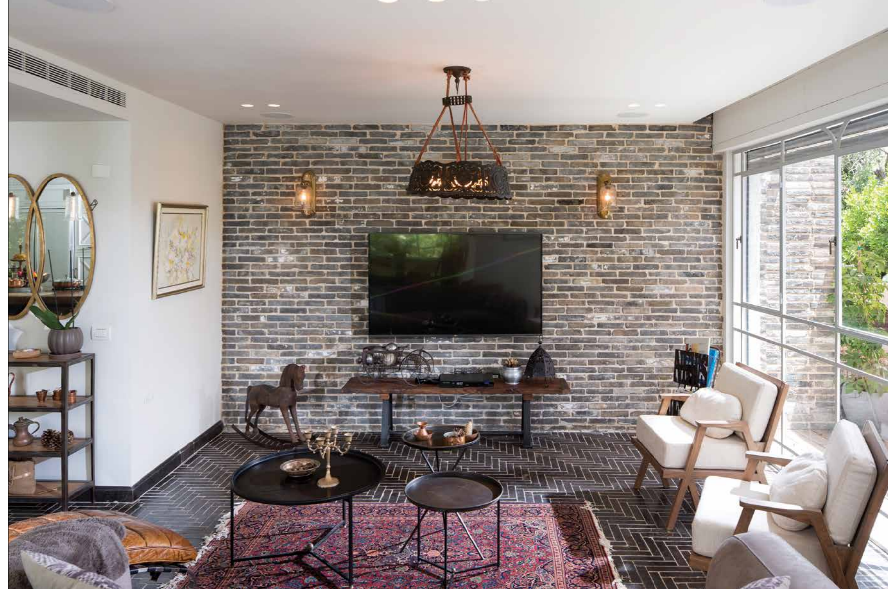
עיקר השינוי נעשה בתוך הבית. האלמנט הבולט ביותר בבית המשפיע על כל עיצוב הפנים הוא ללא ספק הרצפה. אריחים מלבניים של אבן בלוסטון, שרופה, מלוטשת ומיושנת, הונחו בצורת אדרת דג